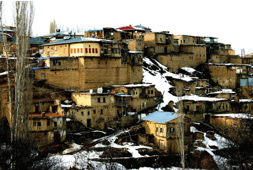
Divriği'deki kültür turizminin potansiyel odaklarından biri Tuğut köyü.