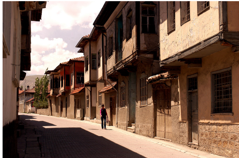
Divriği'nin tarihi dokusunu koruyan sokaklarından biri.